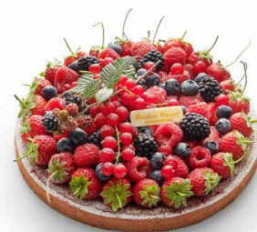
Tarte aux fruits rouges (IDÉALEMENT À PARTIR DE JUILLET) 🇫🇷 Pâte sablée, crème d'amande-pistache et fruits rouges