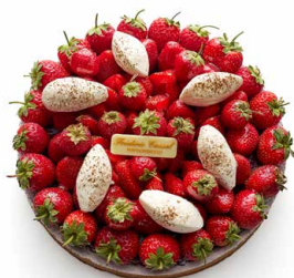
Tarte fraises-pistache (AVRIL) 🇫🇷 Pâte sucrée, crème d'amande pistache, marmelade de fraises et chantilly vanille

PRIX DES TARTES : 34€ / 4-5 P • 48€ / 6-7 P Photos non contractuelles