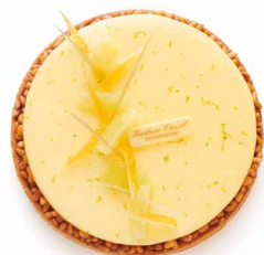
Citron 🇫🇷 Pâte sablée, biscuit moelleux amandes, marmelade de citron, crème citron et pignons de pins grillés.