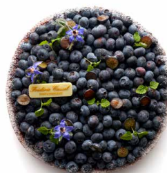
Tarte myrtille-menthe-cannelle (SEPTEMBRE) 🇫🇷 Pâte sucrée, roll cake cannelle, Namelaka menthe fraîche, Myrtilles fraîches