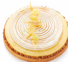
Citron meringuée 🇫🇷 Pâte sablée, biscuit moelleux amandes, marmelade de citron, crème citron et pignons de pins grillés, meringue.