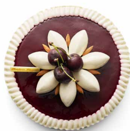
Tarte cerise acacia (MAI) 🇫🇷 Pâte sucrée, crème d'amande pistache aux griottes, gelée de cerises noires et Chantilly acacia