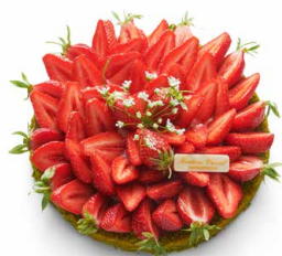
Tarte sablée aux fraises (D'AVRIL A JUILLET SELON LE MARCHÉ) 🇫🇷 Pâte sablée, crème d'amande-pistache et fraises