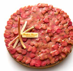
Tarte rhubarbe Sichuan (JUIN) 🇫🇷 Pâte sucrée, biscuit financier, riz au lait vanille, compotée de rhubarbe aux baies de Sichuan, rhubarbes pochées