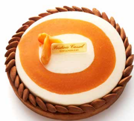
Tarte abricot-chocolat blanc (JUILLET-AOÛT) 🇫🇷 Pâte sucrée, biscuit moelleux amandes, ganache montée vanille, abricots rôtis et confit d'abricot