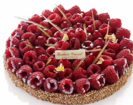
Tarte sablée aux framboises (IDÉALEMENT À PARTIR DE JUIN) 🇫🇷 Sablé breton, marmelade de framboises, framboises fraîches